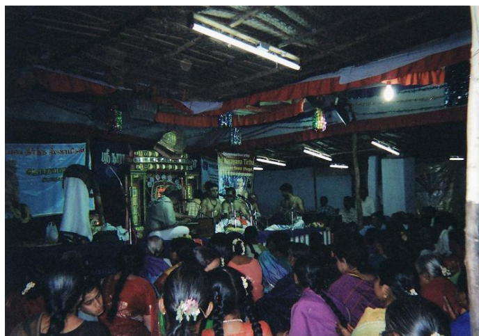
写真6 2007年度NTAの様子（ナーマ・サンキールタナ）