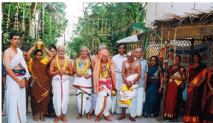
写真5 2009年度NTAの様子（ウンチャヴリッティを模した儀礼）