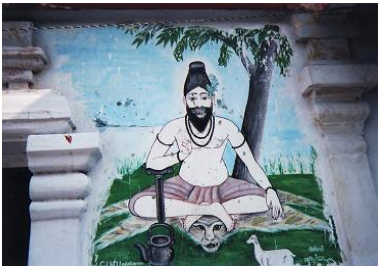
2007 年 5 月筆者撮影。