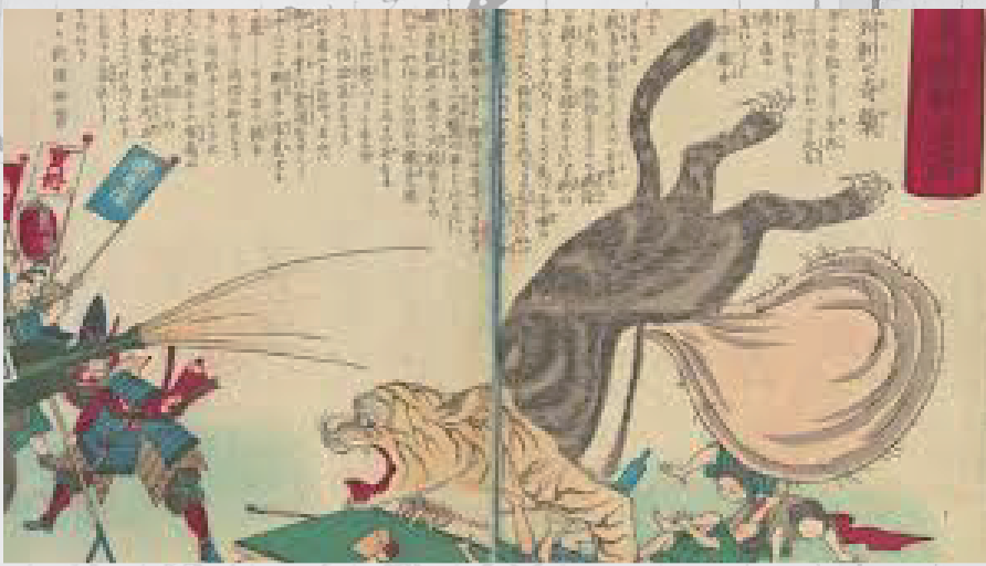
「虎列刺退治明治」明治19年 くすり博物館収蔵資料集(4) はやり病の錦絵