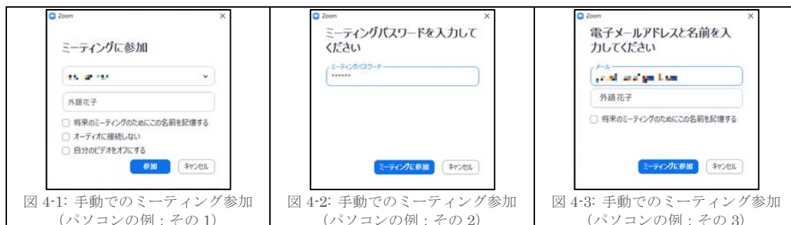
図 4-1: 手動でのミーティング参加 (パソコンの例: その 1)

ソフトまたはアプリが自動的に立ち上がらない場合は手動で立ち上げ、「ミーティングに参加」をクリック後、通知メールに記載されているミーティング ID (図 3 の②) と自分の名前を入力し、すべてのチェックを外した上で「参加」を押し (図 4-1 参照)、ミーティングパスワード (図 3 の②) を入力して「ミーティングに参加」を押してください (図 4-2 参照)。もう一度メールアドレスの入力を求める画面が現れたら、登録時のアドレスを入力して「ミーティングに参加」を押します (図 4-3 参照)。