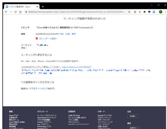
図 1：参加登録完了後の画面

定員超過の場合、抽選の上、当日午前 9 時ごろまでにメールで結果が通知されます。参加が認められなかった場合は、別の回に登録し直してください。何も通知がなければそのまま参加してください。