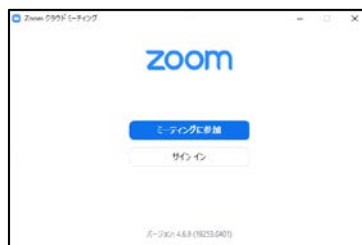
図 2：インストール直後の画面

インストールが完了したら(図 2 参照)、何もせず×をクリックしてソフトを閉じます。