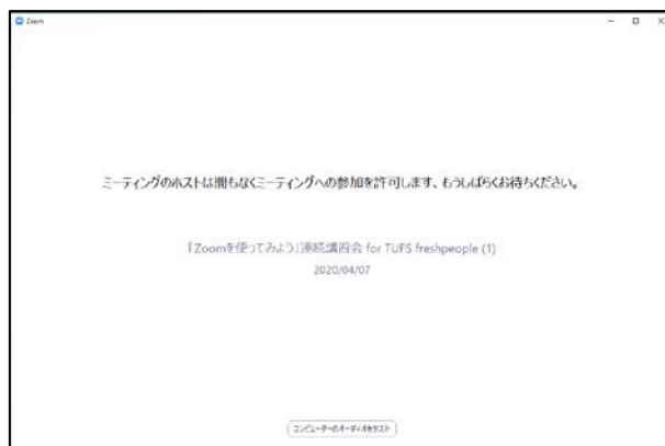
図 5: 入場直後の画面