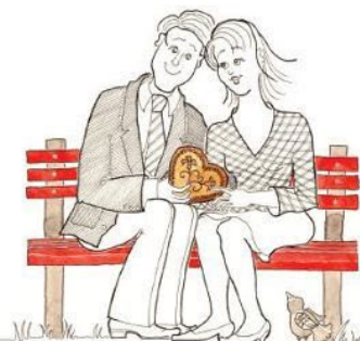
onadva sedita they are sitting