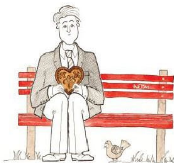
on sedi he is sitting