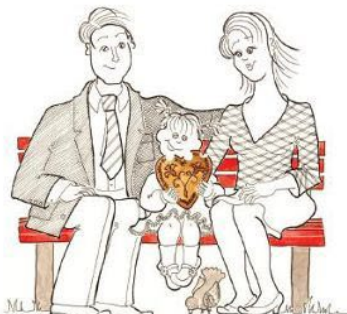
oni sedijo they are sitting