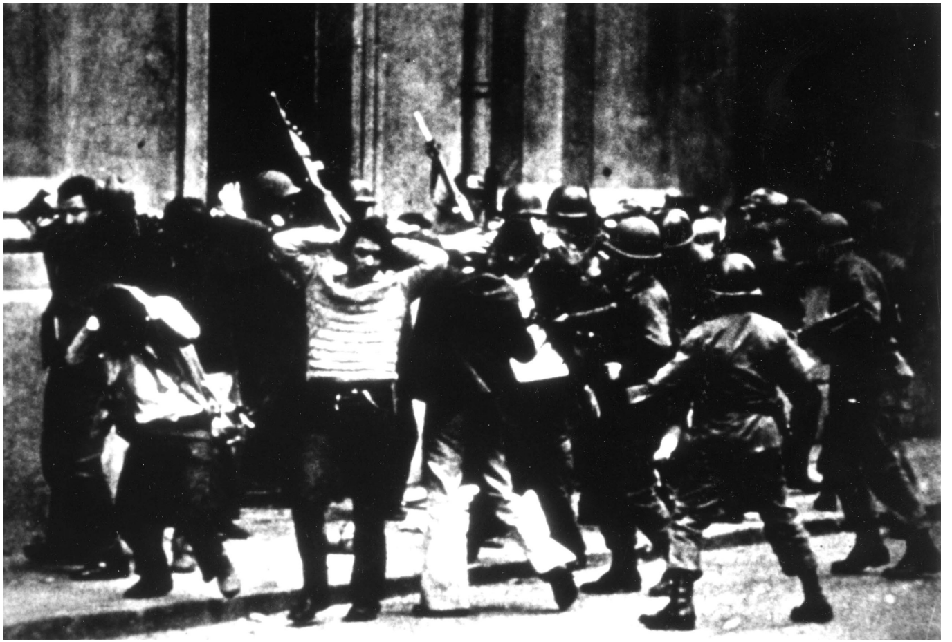
©1975, 1976, 1978 Patricio Guzmán