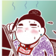
蔵西 (漫画家、イラストレーター)

専門は社会人類学、チベット現代史、チベット現代文学。近年は台湾史学思想史やチベット仏教のグローバル化の歴史にも関心を寄せています。主な業績に「チベット旧社会の村落構造をめぐって：ダライ・ラマ政権の村落支配」岩尾一史・池田巧編「チベット・ヒマラヤ文明の歴史的展開」(京都大学人文科学研究所、2018年)、主な訳書にペマ・ツェテン「チベット文学の現在 ティメー・クンデンを探して」(皇泉との共訳、勉誠出版、2013年)などがある。「SERNYA」編集部メンバー。