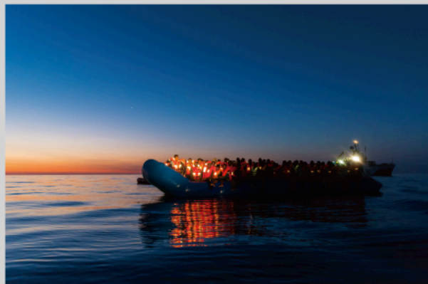
「夜明けにゴムボートで救出を待つ移民たち。NGO「移民沿岸支援団 (MOAS)」の救助活動にて。」