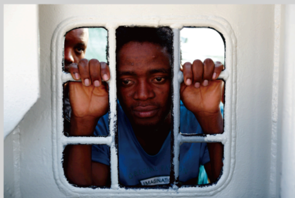
「NGO「国境なき医師団 (MSF)」の救助船「ブルボン・アルゴ号」から窓の外を見つめる移民。」