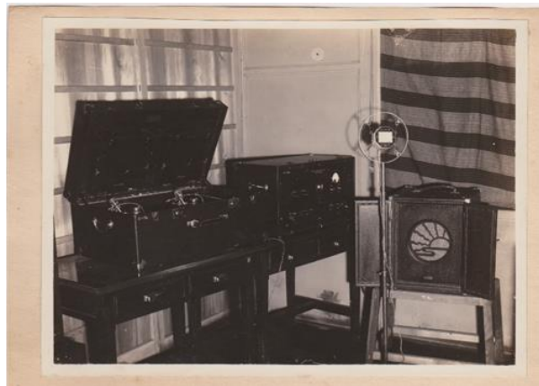
「旧音声学研究施設」マイクロフォン (上智大学・国際言語情報研究所・音声学研究室所蔵)

同実験室での研究成果を踏まえた『母音論』(The Vowel, Its Nature and Structure. Tokyo-Kaiseikan, 1941)は、今日に至るまで言語学・音声学の古典とされています。1945年、同校を定年退職した後、1950年より上智大学教授に就任し、同大学において音声学実験室を創始しました。