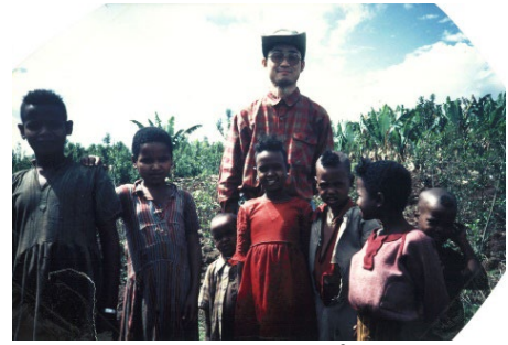
(1986年、エチオピアにて)

ゼミで保護する責任、国際刑事法、サイバー攻撃と自衛権について研究していた3名の学生たちが、それぞれ防衛省に総合職で採用された後、イギリスやオランダの大学院へ留学する際、私は推薦状の執筆を依頼され、嬉しい出来事でした。