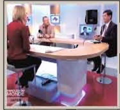
在フランス日本大使館 スポークスマンとして、 フランスのテレビ番組に出演。

この頃私は、在フランス日本大使 館で広報文化を担当していた。大使 館のスポークスマンとして、日本政 府の立場や政策についてフランス国 民に広報し、その理解を得られるよ う努める、というのが与えられた任 務の一つであった。その場合、メイ ディアを活用することが最も効果的だ ることと言うまでもないが、なか