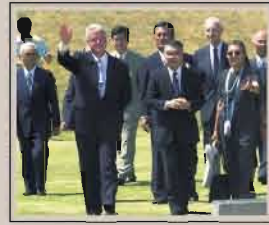
「平和の礎」を訪れた クリントン・アメリカ大統領(当時) を後方からエスコート。

前日まで、キャンプアビッドで 中東和平交渉の仲介を行っていたク リントン大統領は、いったん交渉を 切り上げ、大統領専用機、エアフォ ー