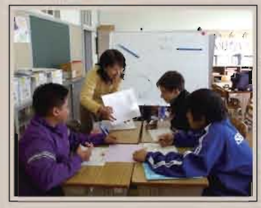
外国人生徒のための日本語教室の様子(浜松市)。

昨秋のいわゆる「リーマン・ショック」以来、輸送用機器や電気機器などの製造業では全国的に非正規雇用労働者の大量解雇が行われている。浜松市でも多くの外国人労働者が解雇され、職とともに住居を失うなど非常に厳しい状況に立たされている。今こそ日本の外国人政策を大きく転換すべき時である。