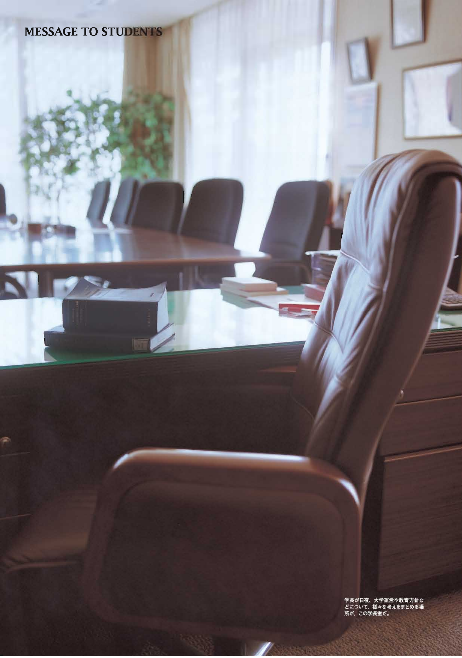
学長が日夜、大学運営や教育方針などについて、様々な考えをまとめる場所が、この学長室だ。

「言語」、コミュニケーションのためのツールとなりうるわけです。「言語」と「教養」、このどちらもこれからのグローバル時代には欠かせない要素です。