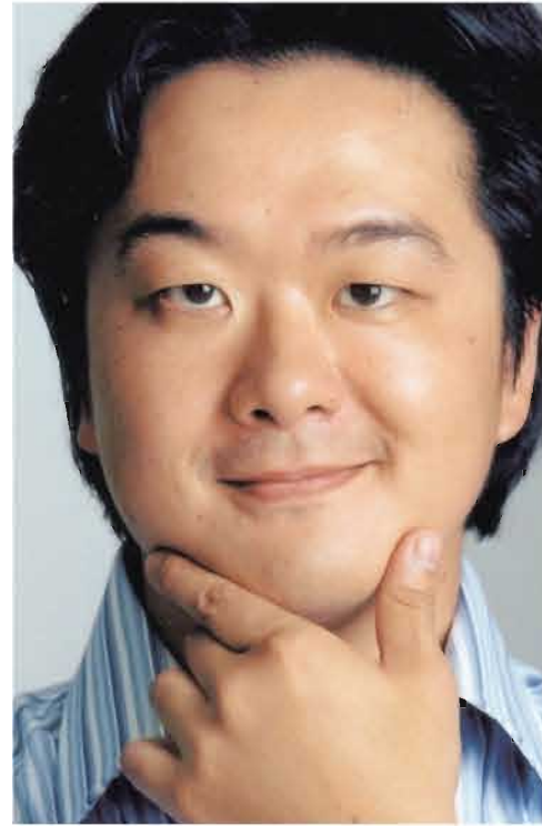
© Tetsuro Goto 03: MURANAKA Daisuke Graduated from Dept. of German studies in 1990.