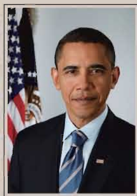
バラック・フセイン・オバマ。第44代アメリカ合衆国大統領。

オバマを支持した公民権法成立以降の若い世代は、20世紀半ばまで南部の現実だった、黒人差別のひどい実態を知りません。かれらは肌の色に関わらず、オバマ個人の能力と人間的魅力、大統領としての資質の可能性に投票したのでしょう。そのようなア