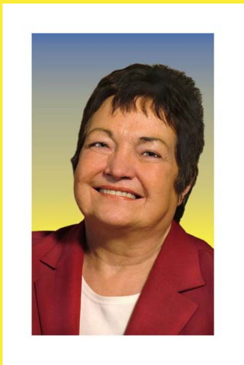
マイレッド・マグワイア