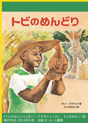
『トビのめんどり』ポリー・アラキジャ=さく さくまゆみこ=訳 発行年月:2014年8月 出版:さ・え・ら書房

東京外国語大学 総務企画課 広報係 ☎183-8534 東京都府中市朝日町3-11-1 Tel: 042-330-5150 (土日祝をのぞく9:00-17:00) Email: soumu-koho@tufs.ac.jp