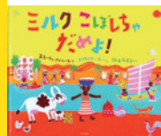
『ミルクこぼしちゃだめよ!』文:ステイヴン・デヴィアーズ 絵:クリストファー・コー、訳:福本友美子、ほるぷ出版、2013年

子どもの頃にたくさん読んだ「絵本」。わたしたちだけでなく、世界中の子どもたちが絵本を読んでいます。アフリカで暮らす子どもの生活を、想像したことはありますか? アフリカの多様な側面を、わたしたち人間の生活に密着した「絵本」から、垣間見ることができるかもしれません。アフリカ絵本の展示に加えて、子どもを対象にした絵本の読み聞かせも行います。