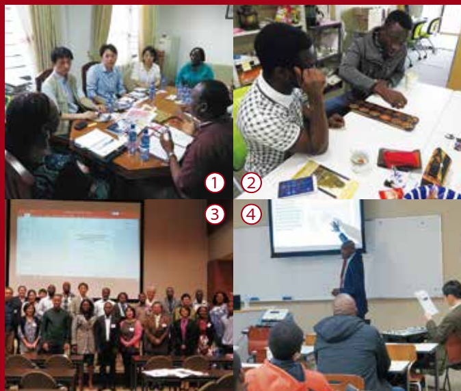
①International exchange meeting (University of Ghana). ②ASC office in which international students can interact. ③International symposium organized by ASC. ④ASC Seminar facilitated by international scholars.

On the basis of long tradition of African studies at Tokyo University of Foreign Studies (TUFS), African Studies Center - TUFS (ASC - TUFS) was established in April 2017 as a Japanese research center on contemporary Africa. Through its various activities including research and education, seminars and symposia, invitation of researchers, promotion of student exchange, and so on, ASC - TUFS contributes to building network on contemporary Africa. The results and achievements are widely shared through publications and the website.