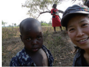
ケニアのヴィクトリア湖周辺に暮らすルオ(LUO)の人びとの村に、1995年から断続的に住み込んで人類学の調査をしています。

専門は社会人類学、東アフリカ民族誌。ケニアとウガンダの農牧村、近年は首都ナイロビ、カンバラにおいて調査。家族、親族の関係性、セクシュアリティ、ジェンダー、また人びとが居住する空間や人間関係について関心がある。ケニアの寡婦の調査からはじまり、「シングル」の研究、結婚、家族のありかたの変化などを継続してきている。