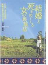
椎野若菜『結婚と死をめぐる女の民族誌』世界思想社、2008