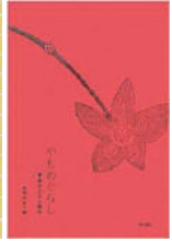
椎野若菜編『やもめぐらしー寡婦の文化人類学』明石書店、2007