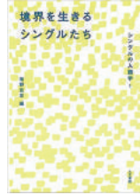
椎野若菜編『境界を生きるシングルたち』人文書院、2014